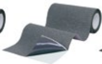
Zinkrau (RAL 7011)