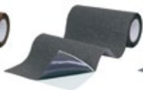
Anthrazit (RAL 7016)