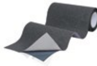
Anthrazit (RAL 7016)